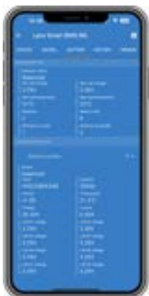
Présentation complète de toutes les données de la batterie via VictronConnect (ou un dispositif GX et le portail VRM)

Les batteries Victron Energy Lithium NG sont des batteries au lithium fer phosphate (LiFePO 4 ou LFP) disponibles dans différentes capacités avec des tensions nominales de 12,8 V, 25,6 V et 51,2 V. Elles peuvent être raccordées en série, en parallèle ou en série/parallèle, de sorte qu'un parc de batteries peut être construit pour des tensions de système de 12 V, 24 V ou 48 V. Un maximum de 50 batteries peut être utilisé lors de la configuration d'un parc avec des batteries de 12 V ou 24 V, tandis qu'un maximum de 25 batteries peut être utilisé avec des batteries de 48 V. Cela permet une capacité maximale de stockage d'énergie de 192 kWh avec des batteries de 12 V, jusqu'à 384 kWh avec des batteries de 24 V et 128 kWh avec des batteries de 48 V.