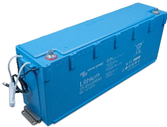
Fixé avec des supports de