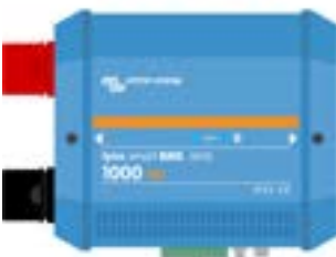
Lynx Smart BMS NG 500 A et 1000 A