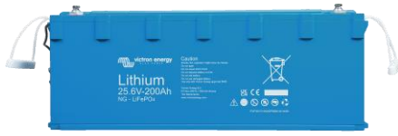
Batterie Lithium NG 25,6 V 200 Ah