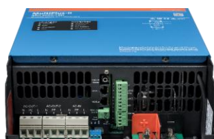
Zone de connexion MultiPlus-II 4k5